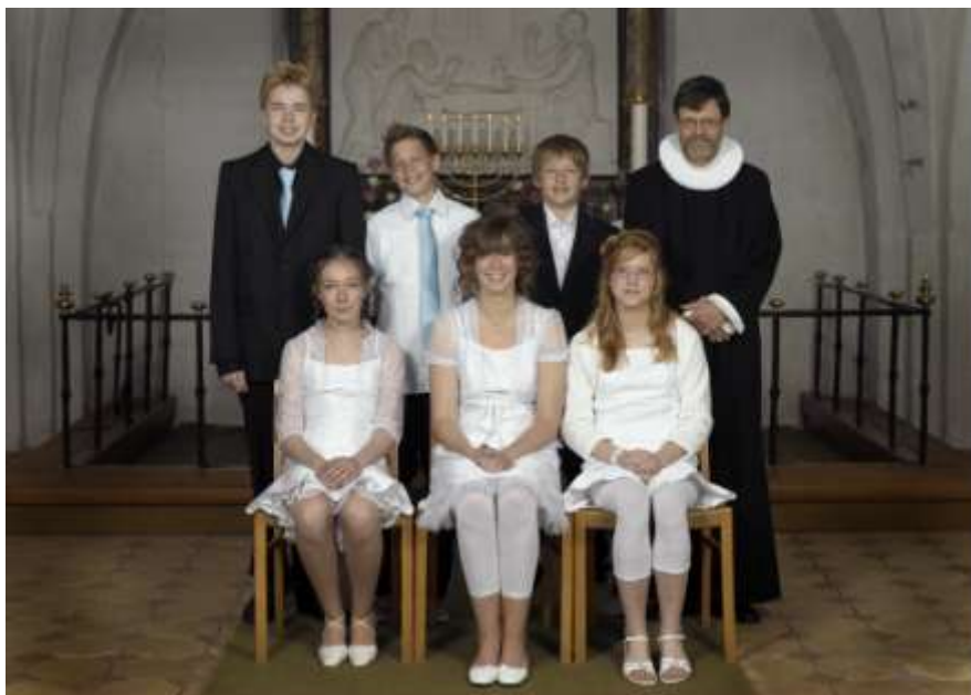
Forårets konfirmander fra Junghoved Kirke 2007