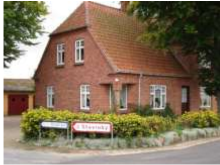
Jungshovedvej nr. 44

Grunden er 2500 kvadratalen stor og kostede 1 kr. pr. alen.