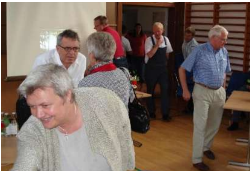
Snakken går på borgermødet den 5. juni

Tlf.: 55 36 26 85, e-mail: anv@vordingborg.dk