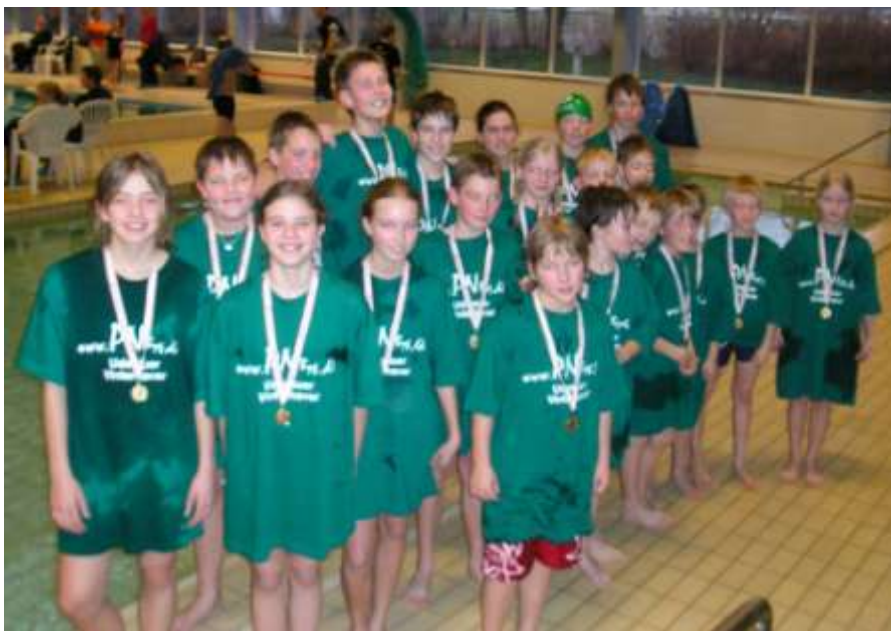
JIF-svømmere til svømmestævne i Haslev 4/2 2007