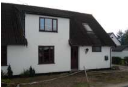
Jungshovedvej nr. 54