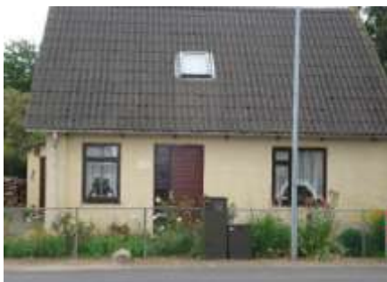
Jungshovedvej nr 50