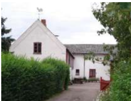
Ejendommen på Jungshovedvej nr 49

flyttet til gården ved de nye bygninger. I midten af 30'erne blæste vingerne af møllen under en storm. De landede i