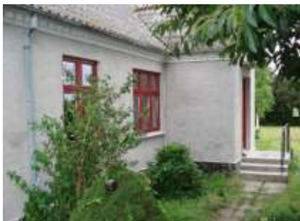
Jungshovedvej nr. 35