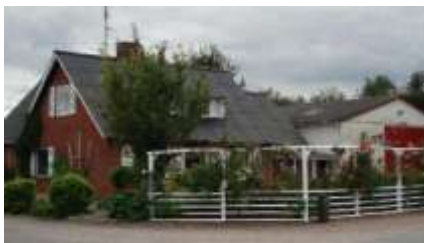
Jungshovedvej nr. 38