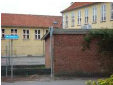
Jungshoved Skole og den røde mur