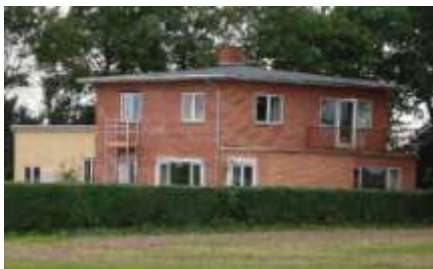
Det tidligere mejeri

blev moderniseret i 1938 og skolen i 1939. Mejeriet brændte over to omgange omkring nytårsaften 1980. Den første brand brød ud kl. 17.30 d. 31.12. 1980 og den næste nytårsdag 1981. Ved den første brand brændte 1/3 af