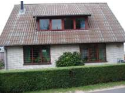
Jungshovedvej nr. 47