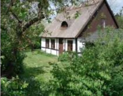
Sadelmagerhuset i Stenstrup

Ved byens gadekær i det lille strå-tækte hus, der nu i daglig tale kaldes ”feriehuset”, var der indtil en-