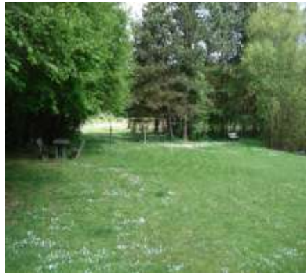
Her var sprøjtehuset ved Stenstrup gadekær