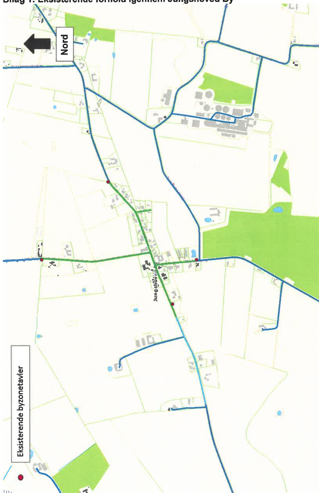
Figur 1 Mørkeblå farve symboliserer 80 km/t, turkise farve symboliserer hastighedsbegrænsning på 60 km/t, grøn farve symboliserer 50 km/t.