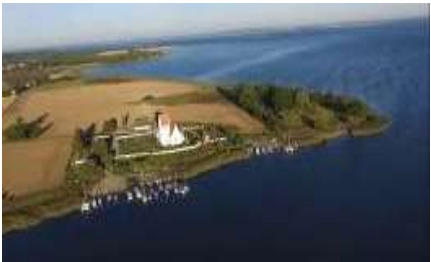
Jungshoved kirke med begge havne