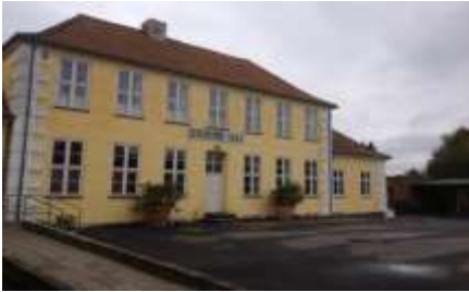
Egnshuset Jungshoved Skole